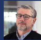
Jean QUATREMER Journaliste, correspondant du quotidien français Libération auprès de l'Union européenne, auteur de plusieurs ouvrages et reportages sur la politique de l'Union européenne.