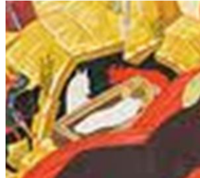
La nativité, Roulev (XVème siècle)