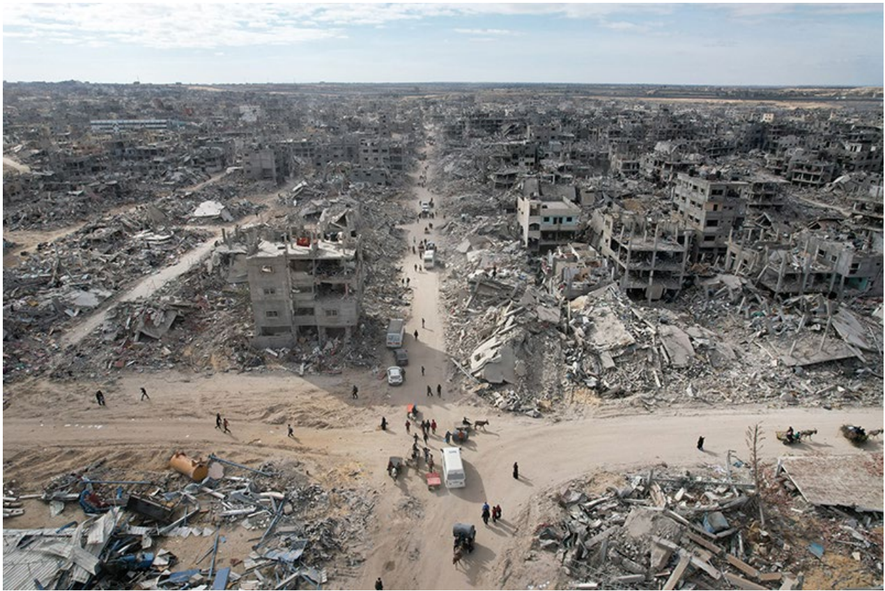
Palästinenser kehren nach der zwischen Hamas und Israel vereinbarten Waffenruhe in die Ruinen von Rafah zurück, 20. Januar 2025.

dabei der Schutz der Zivilbevölkerung von der Netanjahu-Regierung als nachrangig betrachtet wird, um ihrerseits das israelische Kriegsziel zu erreichen, wurde von der palästinensischen Führung erwartet und sogar unterstützt. Im Gegenteil: Je mehr Tote im Kampf gegen die Zionisten „fallen“, und dann als Märtyrer und „Blutzeugen“ (so die wortwörtliche Übersetzung von šahīd ) gelten, desto besser. Was mit der palästinensischen Bevölkerung Gazas geschieht, war für ihre eigene Regierung, wieder einmal, nebensächlich. Das ist die eigentliche Tragik der Geschichte der Palästinenser. Das Ende von Jahia Sinwar, des Führers des Regierungsregimes in Gaza und Mastermind der Hamas inmitten der Ruinen Rafahs, darf hier als Sinnbild eines erweiterten Selbstmordes 13 xiii als höchste Märtyrertat islamischer/islamistischer Auslegung gelten.