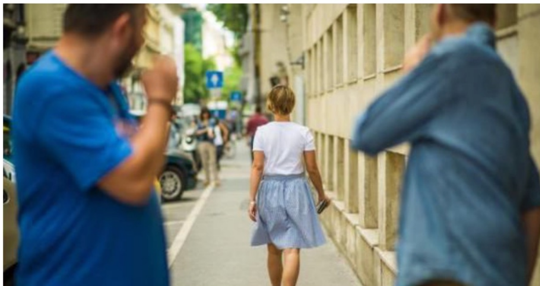
Le harcèlement de rue est également une réalité au Luxembourg.

LUXEMBOURG - Faut-il légiférer sur le harcèlement des femmes dans la rue? Tout le monde n'y est pas favorable. La police livre ses recommandations.