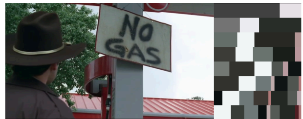
Abbildung 2: Clusteranalyse eines Frames aus The Walking Dead mit 2 bis 9 Clustern. Die Anzahl von 2 Clustern erzeugt den besten Silhouette Koeffizienten.

Tatsächlich gibt es ein überwachtes Verfahren in dem K-Means in einer Schleife mit unterschiedlicher Clusteranzahl auf den selben Frame angewendet wird und im Sinne des sogenannten Silhouette Koeffizienten das beste Ergebnis bestimmt wird. Allerdings entspricht ein Clusteringergebnis bei dem die Clusterzentren bei weitestgehender Kompaktheit möglichst weit voneinander entfernt sind nicht unbedingt dem filmwissenschaftlich brauchbarsten Ergebnis (siehe Abbildung 2).