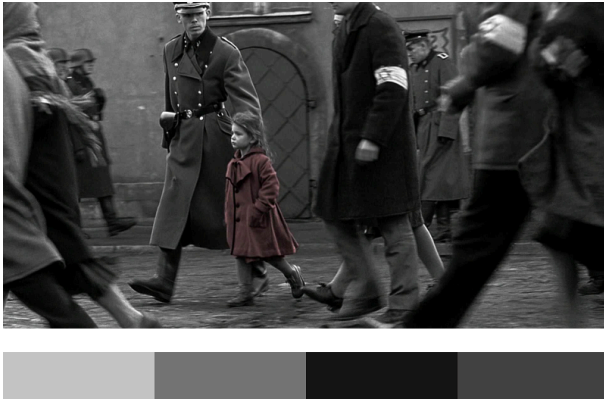
Abbildung 3: Farbclustering eines Ausschnitts aus Schindlers Liste

Das Problem der Präferenz für eine gleichmäßige Größe von Clustern sowie das zuletzt genannte zeigen die Notwendigkeit auf, die Idee einer dominanten Farbe im Kontext der computerunterstützten Filmanalyse stärker zu diskutieren. Dies ist bisher jedoch nur unzureichend erfolgt. Ein Mitgrund hierfür ist der Umstand, dass die genannten Projekte keine filmwissenschaftliche Deutung in Zusammenhang mit ihren Entwicklungen publiziert haben. Dadurch bleibt völlig offen, welche Semantik die erzeugten Muster tragen und inwieweit sie die Interpretation von Filmen beziehungsweise Filmkorpora inspirieren können. Dieser eher theoretische Problematik lässt sich auch nicht durch ein Ausweichen auf andere Clustering-Algorithmen wie DBSCAN oder Verfahren wie hierarchisches Clustering entgehen.