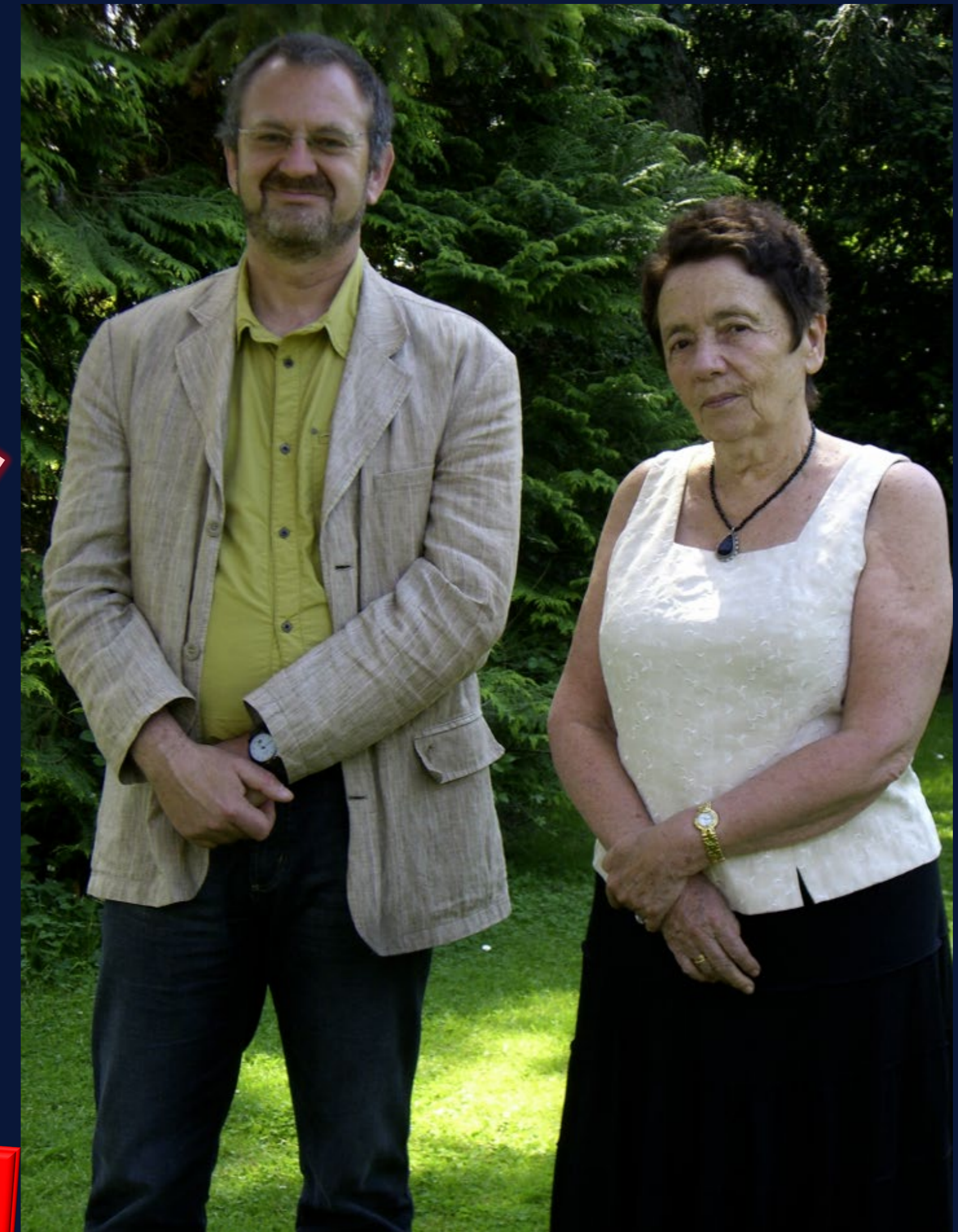
DS et IG / Le Perray en Yvelines / mai 2009

Благодарю Вас за внимание Danke für Ihre Aufmerksamkeit