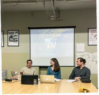
SOIRÉE DISCUSSION AVEC LE GUEULOIR À LA KULTURFABRIK.

QUELQUES SEMAINES AVANT L'ARRIVÉE DE MARIANA À ESCH, LA KULTURFABRIK ACCUEILLAIT UN RDV STAMMDËSCH #2. UN PROJET ORGANISÉ PAR LE COLLECTIF D'AUTEURS FRANCOPHONES LE GUEULOIR DANS LE CADRE DE ESCH2022 CAPITALE EUROPÉENNE DE LA CULTURE. DU 11 AU 15 JANVIER 2022, AU CŒUR DU QUARTIER DE ESCH-LALLANGE, ENTRE LE CAFÉ «LE PIRATE» ET LA KULTURFABRIK, TROIS AUTEUR.ES AVAIENT ÉTÉ INVITÉS À VENIR ÉCOUTER LES HISTOIRES DES HABITANT.ES SUR LE QUARTIER DE LALLANGE POUR ENSUITE ÉCRIRE DES TEXTES. POUR NOURRIR LE TRAVAIL DES AUTEUR.ES, LE GUEULOIR AVAIT FAIT RÉDIGER UN PETIT DOCUMENT SUR L'HISTOIRE DE LALLANGE. UN DOCUMENT RICHE EN ANECDOTES ET INFORMATIONS QUI A PERMIS À L'ÉQUIPE D'ARTISTESCH D'ORGANISER LES RENCONTRES ENTRE MARIANA, LES HISTORIEN.ES ET LES HABITANT.ES.