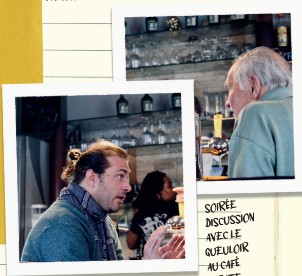
SOIRÉE DISCUSSION AVEC LE GUEULOIR AU CAFÉ PIRATE.