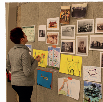
L'ARTISTE CONTEMPLANT LE MUR DE PRODUCTION DES PARTICIPANT.ES