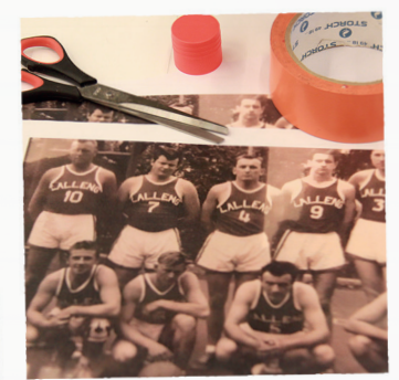
UNE PARTIE DU MATÉRIEL CRÉATIF MIS À DISPOSITION DES PARTICIPANT.ES DE LA SOIRÉE DE DISCUSSION