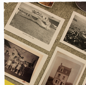
DOCUMENTS REPRENANT DES PHOTOS ANCIENNES DU QUARTIER