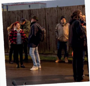
PROMENADE DANS LES RUES DE LALLANGE