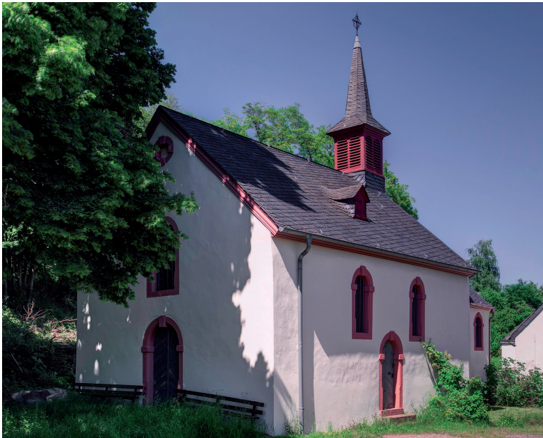
Abb. 6: Die Kapelle des ehemaligen Trierer Leprosoriums St. Jost

Hier bestand für Passanten die Möglichkeit, in speziellen Wegekappen zu beten und in den aufgestellten Almosenkästen zugunsten des Leprosoriums und seiner Bewohner zu spenden. Für das Seelenheil der Spender erschien dies als besonders wirkmächtig, denn die Leprosen galten ja – wie ihre Patrone Hiob und Lazarus – als von Gott Auserwählte, die ihre Leiden bereits zu Lebzeiten verbüßten. Diese religiös motivierte positive Konnotation war wohl auch einer der Gründe für die häufig sehr repräsentative Ausgestaltung der städtischen Leprosorien und ihrer Kapellen (Abb. 6). Sie dienten durch die Anbringung städtischer Wappen auch ganz bewusst dem Prestige der jeweiligen Stadt und ihrer Bürgerschaft. Städtische Provisoren, meist angesehene Ratsmitglieder, führten die Verwaltung, und ein Teil der Finanzierung kam aus den städtischen Kassen. 35