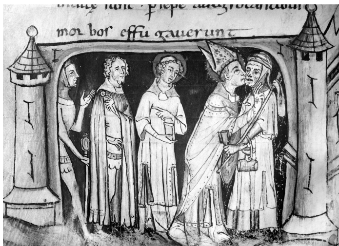
Abb. 2: Der heilige Martin küsst einen Leprakranken