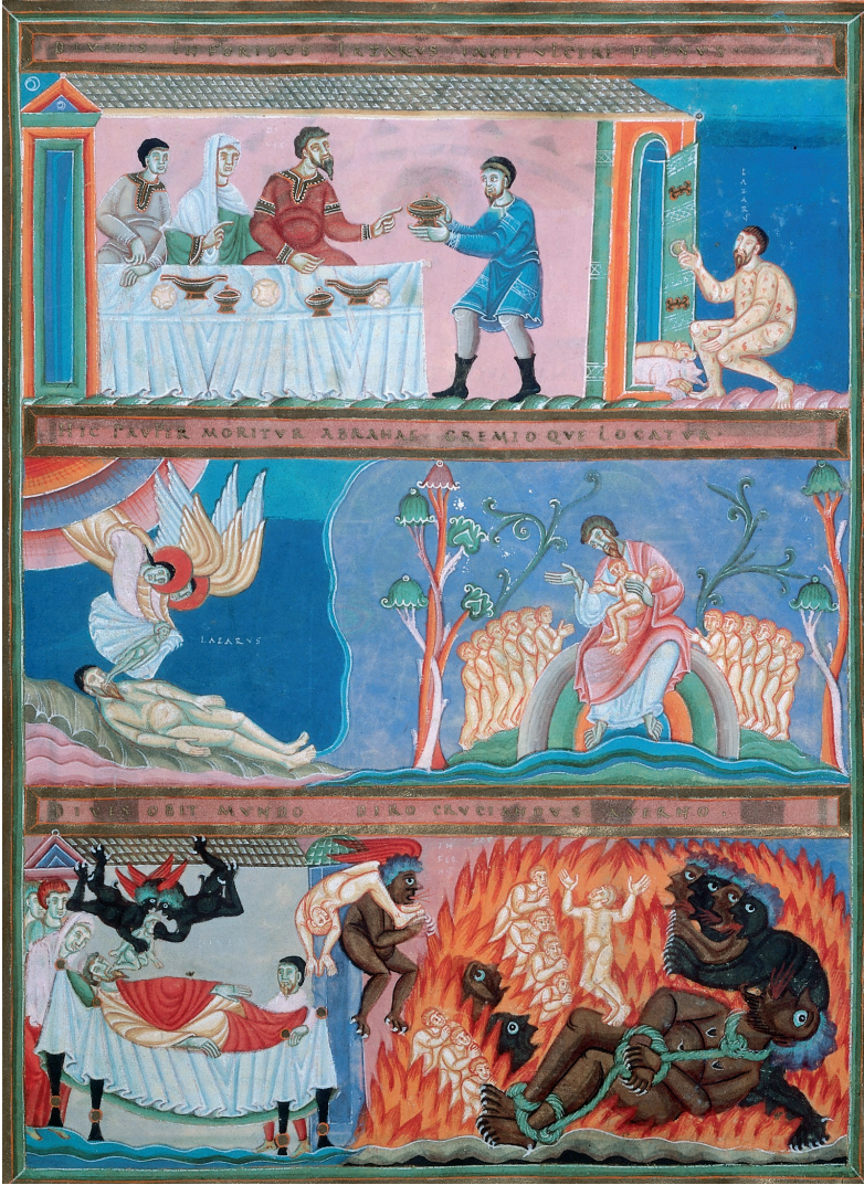
Abb. 4: Der Reiche und der arme Lazarus © Germanisches Nationalmuseum Nürnberg