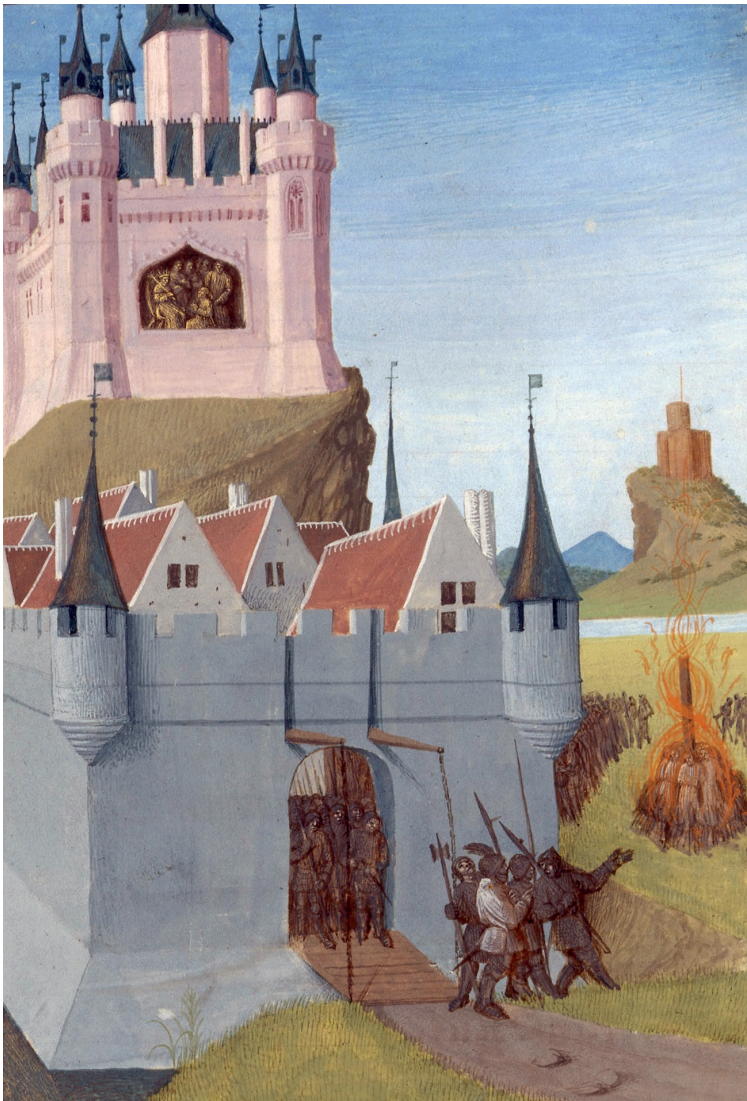
Abb. 7: Darstellung der Leprosenverbrennungen (1321)