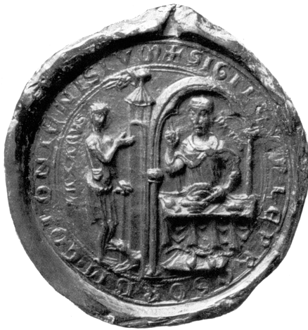
Abb. 5: Siegel des Leprosenhauses Köln-Melaten (1249)

Die Bedeutung dieser biblischen Geschichte spielte eine große Rolle für das Selbstverständnis der Leprosen. So wählten beispielsweise die Leprakranken des größten rheinischen Leprosatoriums in Köln-Melaten das Gleichnis als Siegelbild ihrer Einrichtung, 26 also gewissermaßen als repräsentatives ›Logo‹ ihrer Gemeinschaft par excellence . Genau wie bei den Siegeln von Adeligen, Städten und religiösen Institutionen diente es bei der Besiegelung von Urkunden in hervorgehobener Weise der Außenwirkung und dem Prestige. Das Siegel Melatens aus dem Jahr 1249 (Abb. 5) zeigt das Gleichnis prägnant zusammengefasst in einem Bild: