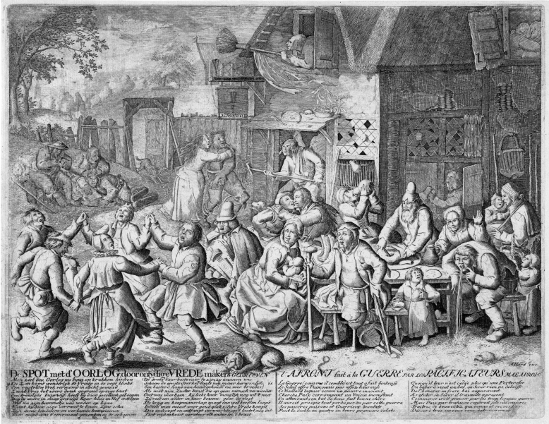
Abb. 8: Prassende Bettler in der Herberge »D' Laserusclep«