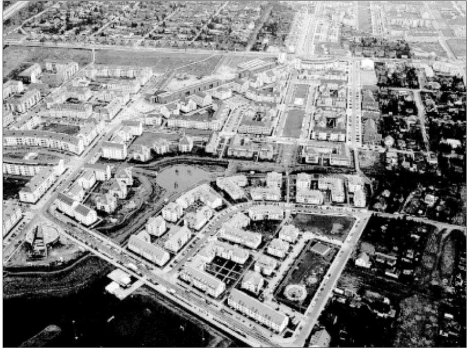
Abb. 2: Übersicht über den zentralen Gebietsteil

bauliche Konzept des amerikanischen Planungsbüros Moore, Ruble, Yudell wurde mit nur geringen Modifikationen umgesetzt. Sein Leitbild des „Menschlichen Maßstabes“ setzte auf Kleinteiligkeit, architektonische und städtebauliche Differenzierung und Vielfalt als Charakteristika. Entsprechend wurde ein neues Siedlungselement in Karow-Blankenburg eingeführt, das eine in sich geschlossene Gliederungsstruktur mit eigenem Zentrum und charakteristischen Bebauungsschwerpunkten aufweist. Zur Gestaltung des Übergangs zum Bestand wurde die Einzelhausbebauung in den angrenzenden Bereichen