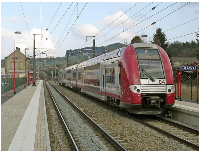
Automotrice de l'entreprise ferroviaire luxembourgeoise CFL à Halanzy (B) à destination de Rodange (L).

d'autobus sont proposées depuis 1992 dans les bassins de Longwy et de Thionville. Subventionnées en grande partie par le Grand-Duché, elles effectuent le ramassage des employés sur différents itinéraires pour les amener à la première gare luxembourgeoise ou les conduire directement dans la capitale.