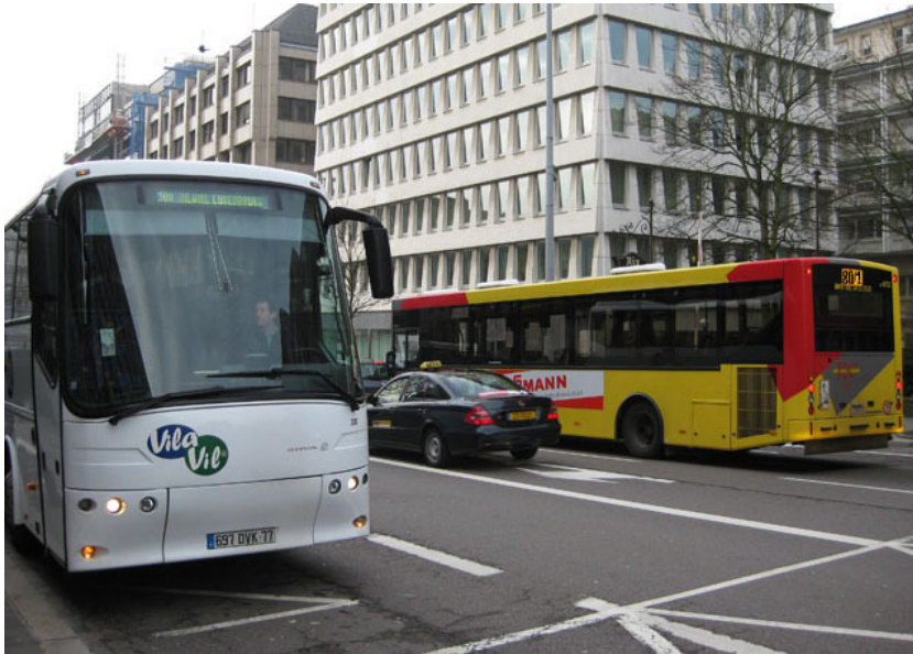
Un autobus de la ligne 300 Hayange/Thionville - Luxembourg de l'entreprise française Transfensch à la gare centrale de Luxembourg.

Bien que le train et l'autobus soient des moyens de transport couramment utilisés pour différents déplacements (achats, excursions, etc.), la concentration des horaires de circulation habituellement observée en début et en fin de journée permet de déduire que les migrants journaliers en sont les principaux usagers. Les lignes transfrontalières ont pour principal objet la desserte du Luxembourg (où le marché de l'emploi s'est considérablement développé au cours des dernières décennies) depuis les anciennes zones industrielles lorraines Longwy et Thionville, la Wallonie, la région de Trèves et la Sarre.