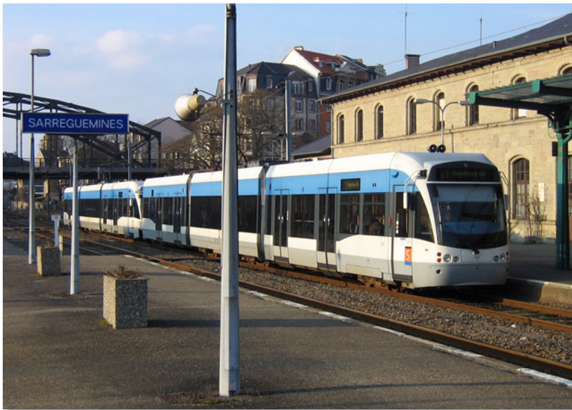
Le tramway urbain de Sarrebruck au terminus à Sarreguemines en Lorraine.

L'aménagement de la ligne de tramway urbain à Sarrebruck en 1997 permet d'intégrer pleinement la ville frontalière lorraine de Sarreguemines dans le réseau de services de transport périurbain de la capitale sarroise.