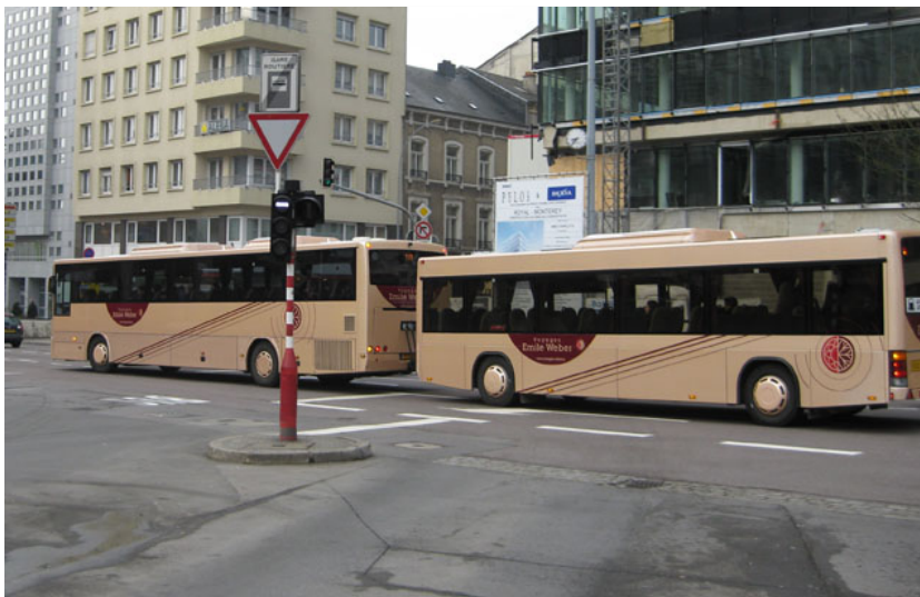
Un autobus de la ligne 118 Trier-Luxembourg. Afin de correspondre à la demande énorme dans les heures d'affluence, des autobus avec remorque sont utilisés, ici à la gare routière centrale de Luxembourg, Place Hamilius.

côté luxembourgeois sont fréquentés chaque jour par plus de 100 000 véhicules. Le SMOT a pour objectif d'augmenter progressivement la part modale des transports alternatifs à la voiture individuelle (transports publics et covoiturage) à 15, 20, puis 25 %. Ces mesures permettront d'une part de désengorger le réseau routier de la Grande Région et, d'autre part, d'offrir à davantage de Lorrains l'opportunité de travailler au Luxembourg. Un doublement de leur nombre est attendu à l'horizon 2030.