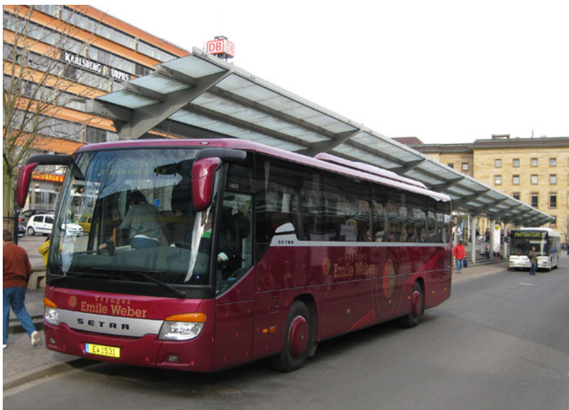
Un autobus du Luxembourg-Saarbrücken-Express et un bus de la ligne Moselle-Saar MS1 de Saarbrücken à St. Avold/Lorraine à la gare centrale de Saarbrücken

En outre il y a des relations d'autobus de Trèves, Schweich, Nittel, Konz et Bitburg à Luxembourg. Près de 25 000 personnes en provenance de Rhénanie-Palatinat (2008, IBA/OIE) se rendent chaque jour au Grand-Duché. En l'absence d'une ligne de train directe, la Sarre (qui compte 6 600 migrants journaliers vers le Luxembourg en 2008, IBA/OIE) dispose de diverses lignes d'autobus qui assurent la liaison entre la région de Saarlouis/Merzig/Perl et le Grand-Duché, les arrêts étant d'autant moins fréquents que la distance parcourue est importante. Dès le Septembre 2015 une nouvelle ligne d'autobus relie Perl (D) via Frisange (L) avec le nouveau site universitaire luxembourgeois Esch-Belval.