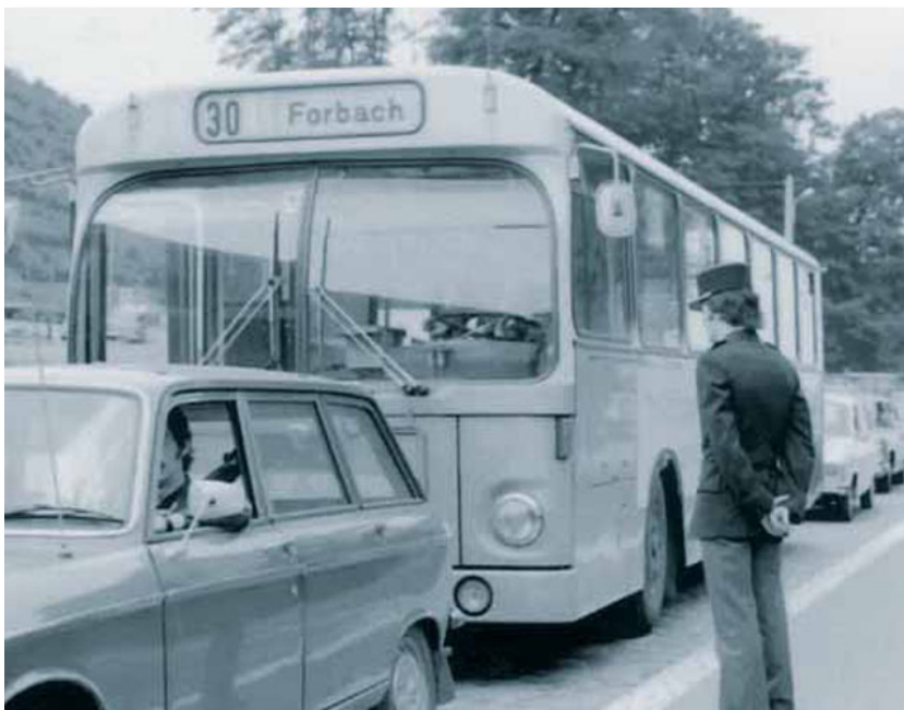
La ligne transfrontalière N° 30 de Saarbrücken à Forbach, dans les années 70 à la frontière Brème d'Or.

Un tarif Sarre-Lorraine a été mis en place au début de l'année 2008 pour les liaisons ferroviaires entre la Sarre et les principales gares lorraines ; ce tarif s'applique aux billets individuels comme aux abonnements. Les tickets individuels sont désormais en vente avec les billets nationaux sur les distributeurs.