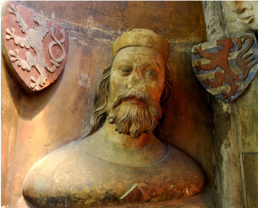
Jean de Bohême (l'Aveugle), pour le Luxembourg comme pour la Bohême Jean Ier, 1313-1346, fils de Henri VII, roi de Bohême depuis 1310. Buste de Jean de Luxembourg dans la cathédrale Saint-Guy de Prague par Peter Parler

Luxembourg et les archevêques des Trèves au 13 ème siècle. Les châteaux d'importance stratégique se trouvent ici plutôt à une certaine distance de Trèves, en direction de Coblençe, à l'exception du château des seigneurs von der Brücke près des thermes de Barbara à Trèves, qui fut toutefois cédé en fief avec une réserve vis-à-vis des archevêques de Trèves.