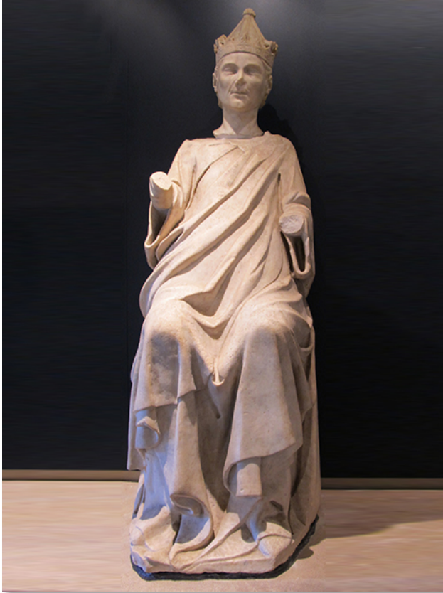
Henri VII, 1278/79-1313, comte de Luxembourg (1288-1313) et de Laroche et marquis d'Arlon. Fils d'Henri VI, roi romain germanique en 1308 sous le nom d'Henri VII, empereur en 1312. Statue de l'empereur provenant de son ancien tombeau dans la cathédrale de Pise par Tino di Camaino, 1313, aujourd'hui Museo dell'Opera del Duomo.

Il faut quand même faire attention au fait que les contrats concernant ces fiefs nous montrent que dans le cas présent la vassalité multiple est fréquente, car la noblesse locale de la Eifel est connue pour avoir mené une politique à la bascule entre des comtes de Luxembourg et de Jülich et les archevêques de Cologne et de Trèves.