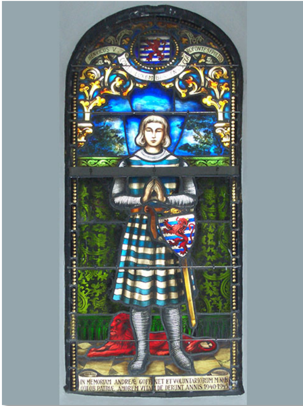
Henri V le Blond, 1216-1281, comte de Luxembourg (1247-1281) et de Laroche et marquis d'Arlon, fils de Walram IV et d'Ermesinde I. Vitrail de la chapelle de la Vierge à Clairefontaine, Belgique.

La plus forte concentration de fiefs se trouve entre les villes de Luxembourg et de Metz, donc sur le territoire de la prévôté de Thionville, qui est marqué par un haut degré d'alleu comtal et non par des anciennes familles nobles.