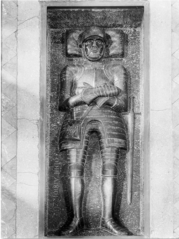
Walram IV de Limbourg, 1160-1226, comte de Luxembourg 1214-1226, plaque funéraire dans l'église abbatiale de Rolduc