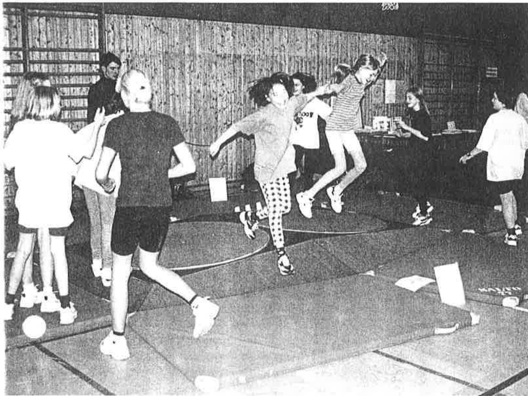
Erfolgslebnisse im Sport müssen von Kindern und Jugendlichen als persönliche Erfolge wahrgenommen werden!

wirksamkeit sind. Unabhängig von den konkreten Ergebnissen dieses Projekts sollten dieser Untersuchungsansatz weiterentwickelt und weitere Studien dieser Art durchgeführt werden.