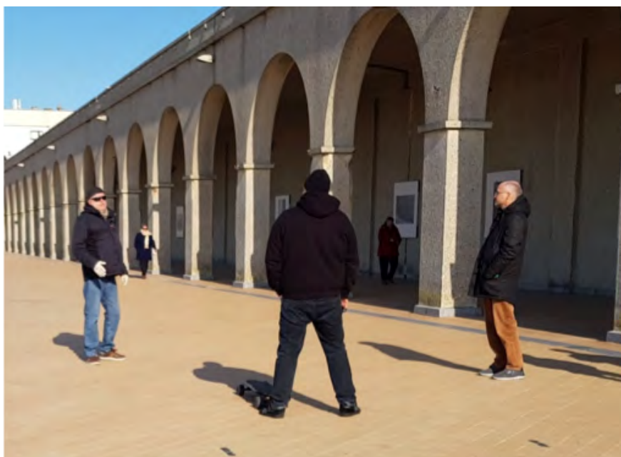
1. Social Distance – Ostende – 22 mars 2020

La phase durative , le « confinement » proprement dit – d'abord une « quatorzaine », puis une vraie « quarantaine » – a vu pulluler les anglicismes : « social distance »,