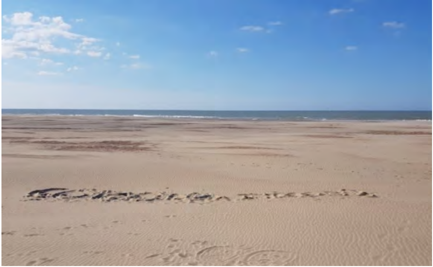
3. Photo de l'auteur : Ostende – 21 mars 2020

Calqué sur la formule de politesse « amicalement vôtre », « confinement vôtre » relève de cet humour de surface dès lors qu'elle traduit une certaine empathie avec le destinataire-compagnon-d'infortune, marquant, par le pronom « vôtre », un « je vous appartiens » et, à la fois, tourne en dérision tout le climat de méfiance lié aux mesures.