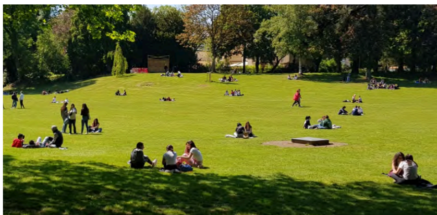
4. Parc Kinnekswiss, Luxembourg – 15 mai 2020

Elan de vie Murs oubliés, Libre (Victoria, étudiant de 2 ième année, mars 2020)