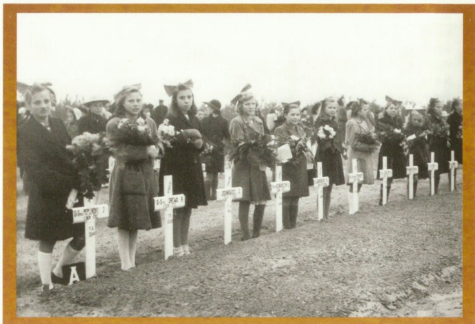
Herdenkingsplechtigheden op de militaire begraafplaats in Lommel, eind jaren 1960 (links) en jaren 1980 (rechts).

België, opgericht in 1945 (Centralna Rada Narodowa). Die mensen kenden de Poolse Volksrepubliek al en hadden een verwaarloosbare invloed op het organisatieleven van Poolse migranten in België. 54