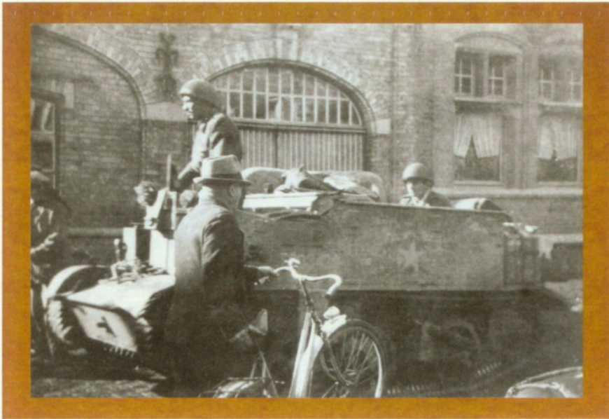
Bevrijding van Ruiselede door de Eerste Poolse Pantserdivisie op 8 september 1944.