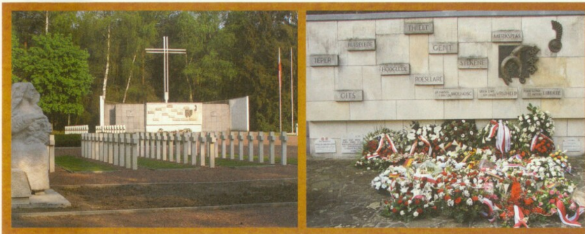
Op de Poolse militaire begraafplaats van Lommel staat een monument dat de Poolse regering grotendeels financierde en dat met een vrachtwagen naar België werd gebracht.

Belgische administratie haar criteria aanpaste en alle gewezen divisiesoldaten een vrijstelling van de registratiekosten voor de aanvraag gunde omdat ze het Belgische vaderland gediend hadden. Daarvoor kwamen gewezen divisiesoldaten enkel in aanmerking voor die vrijstelling als ze in het Duitse leger hadden gevochten (al dan niet verplicht), vervolgens gedeserteerd waren en actief waren geweest in de Belgische weerstand en daarna de Eerste Poolse Pantserdivisie hadden vervoegd op haar tocht door België. 75 Een lokale Belgische patriottische organisatie lobbyde dus met succes voor een verbreding van de manier waarop de Belgische staat de Tweede Wereldoorlog herdacht.