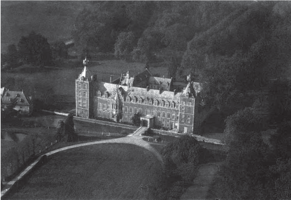
Afbeelding 3: Ongedateerde luchtfoto (vermoedelijk uit de jaren 1920) van het Arenbergkasteel en een deel van het omliggende park.

kon hebben op het stedelijk leefmilieu, was dus ook aan het begin van de jaren 1920 nog niet algemeen aanvaard. Rooien zonder te herbepplanten werd door Le Libéral echter afgewezen als een 'extreme' suggestie. 41