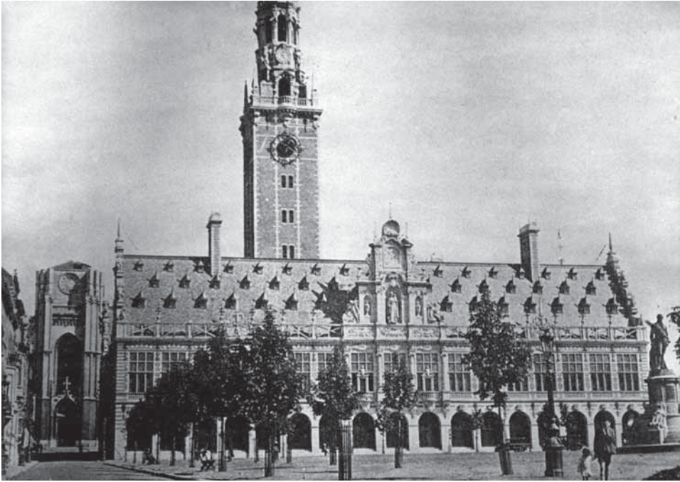
Afbeelding 2: De nieuwe boompjes van de Volksplaats, vermoedelijk aan het eind van de jaren 1920.

deze strategie vooral trachtte om het stadscentrum aantrekkelijker te maken voor de meer gegoede bewoners. 35