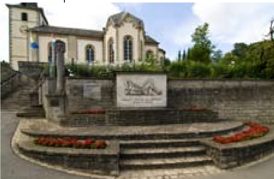
hier steht eine Bildunterschrift

Contrairement à la Première Guerre mondiale dont l'héritage mémoriel reste ambivalent jusqu'à aujourd'hui, la Deuxième Guerre mondiale constitue un élément clé d'histoire luxembourgeoise. La construction de monuments autour de cette expérience de guerre et d'occupation et les commémorations qui s'y tiennent régulièrement étaient et sont encore aujourd'hui un moment important de ré-actualisation de cette charge mémorielle. Localiser dans l'espace et dans le temps cette « Steinwerdung » du souvenir de la guerre permet d'appréhender plus clairement les caractéristiques de la mémoire et de la politique mémorielle relatives à ce qui est pour le Luxembourg la Grande Guerre.