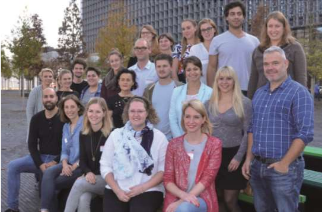
EHEMALIGE BSSE ABSOLVENTEN

Liebe Ehemalige, auch dieses Jahr treffen wir uns um 14:30 Uhr für ein Foto am Eingang.