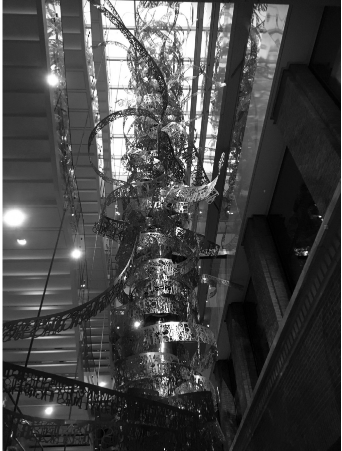
Die »Zitatenranke« als Doppelhelix des europäischen Kulturerbes?

zentralen Navigationsgerät zu, welches man am Eingang des Hauses nach Abgabe seines Personalausweises überreicht bekommt: ein Tablet samt Kopfhörer, die gleichermaßen als Audioguide und interaktive Schnittstelle zur Aneignung objektgebundener Informationen der präsentierten Sammlung dienen. Liegen die Vorteile eines Tablets als interaktives und multimediales Informationsmedium sprichwörtlich auf der Hand (zum Beispiel können sämtliche Informationen in den 24 Amtssprachen der Europäischen Union abgerufen werden), so irritiert die Tatsache, dass in der Ausstellung auf jegliche noch so knappe Beschriftung der Objekte verzichtet wird. Nur mithilfe des Tablets können Besucher kurze Informationen zur Bedeutung, zeitlichen Einordnung und Herkunft von Ausstellungsobjekten erhalten.