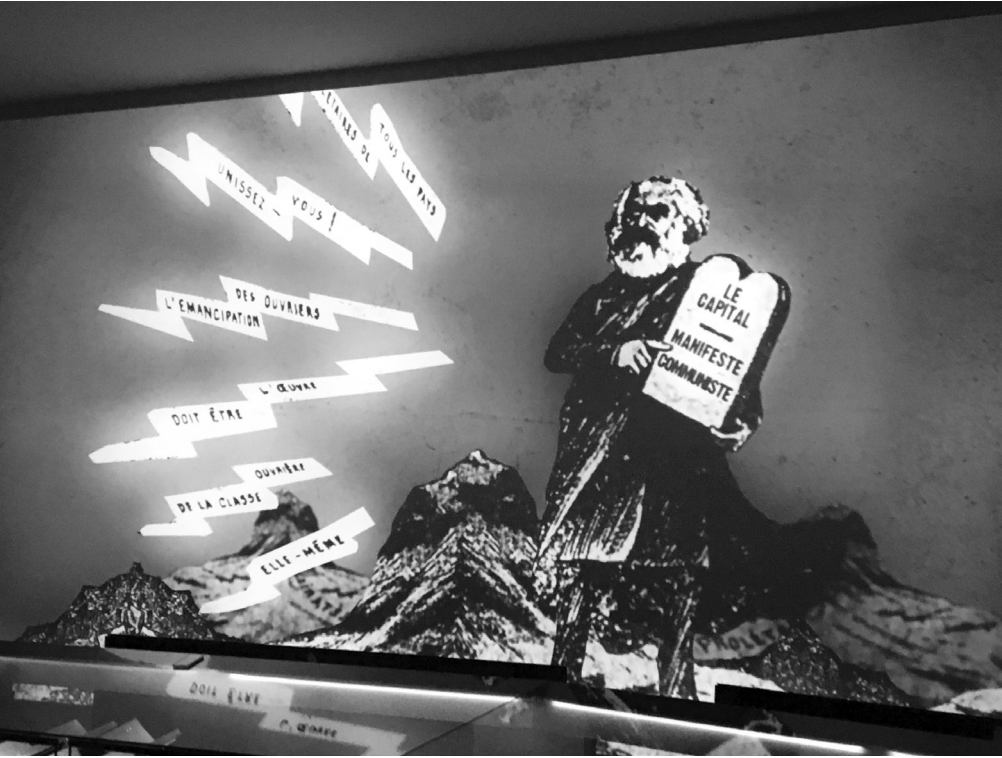
Von der französischen bis zur proletarischen Revolution – audiovisuelle Inszenierung im Eingangsbereich zur dritten Etage und dem Themenblock »Weltmacht Europa«. Karl Marx bzw. »Das Kapital« und das »Manifest der Kommunistischen Partei« werden in einer bewegten Bild-Ton-Montage aufwendig in Szene gesetzt.

Manche Installation – etwa die visuelle Animation historischer Bilder und Karten im Eingangsbereich »Mythos Europa« oder die Deckenprojektion zum Thema »Zukunft Europas« im obersten Stockwerk – vermag es trotz technischer Feinessen allerdings kaum, den Besucher zum Nachdenken anzuregen. Sinn und Zweck einiger Inszenierungen werden erst mit Hilfe des Tablets ersichtlich – der anvisierte Immersions-effekt bleibt aus, zumindest beim Rezensenten. Gelungener werden dagegen einzelne Objekte präsentiert: so etwa die monumentale Inszenierung von 80.000 Seiten EU-Recht durch den niederländischen Architekten Rem Koolhaas oder gekonnte Gegenüberstellungen von historischen Dokumenten aus verfeindeten Lagern, welche unterschiedliche Interpretationen oder Perspektiven ein und desselben historischen Ereignisses je nach politischer, ideologischer oder räumlicher Perspektive zum Ausdruck bringen sollen.