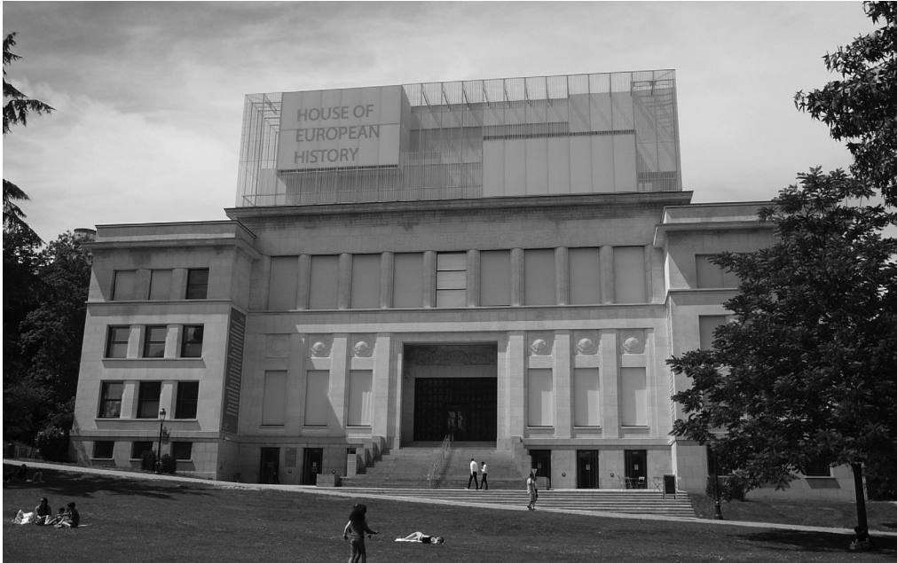
Das Haus der europäischen Geschichte, Außenansicht vom Juli 2017