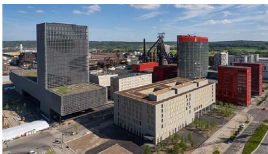
Le site de Belval, faubourg d'Esch-sur-Alzette au Grand-Duché de Luxembourg.