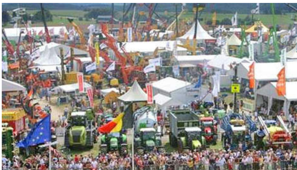
La foire agricole et forestière de Libramont.