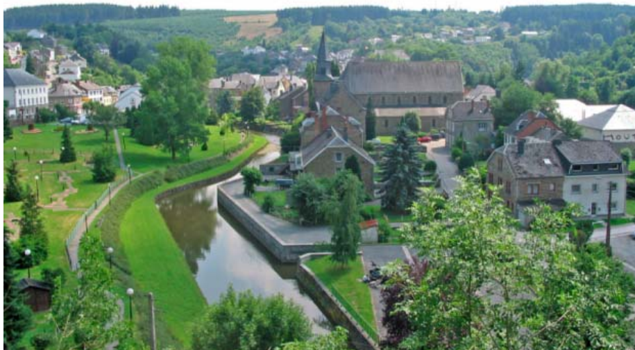
Une vue de Houffalize, petite ville ardennaise traversée par l'Ourthe.