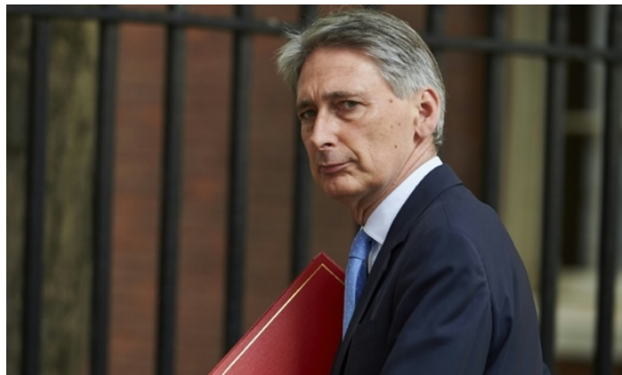
De briteschen Ausseminister Philipp Hammond

„De Referendum ass eng intern Affaire“ a Groussbritannien géing sech net zu séiere Brexit-Verhandlungen presséiere loossen, dat sot den Ausseminister Philipp Hammond dem Sender ITV. Den Timing hätten alleng d'Brite festzeleeën a soss keen. An d'Gesprécher géifen eréischt lancéiert ginn, wann e Successeur fir den Cameron géing feststoen.