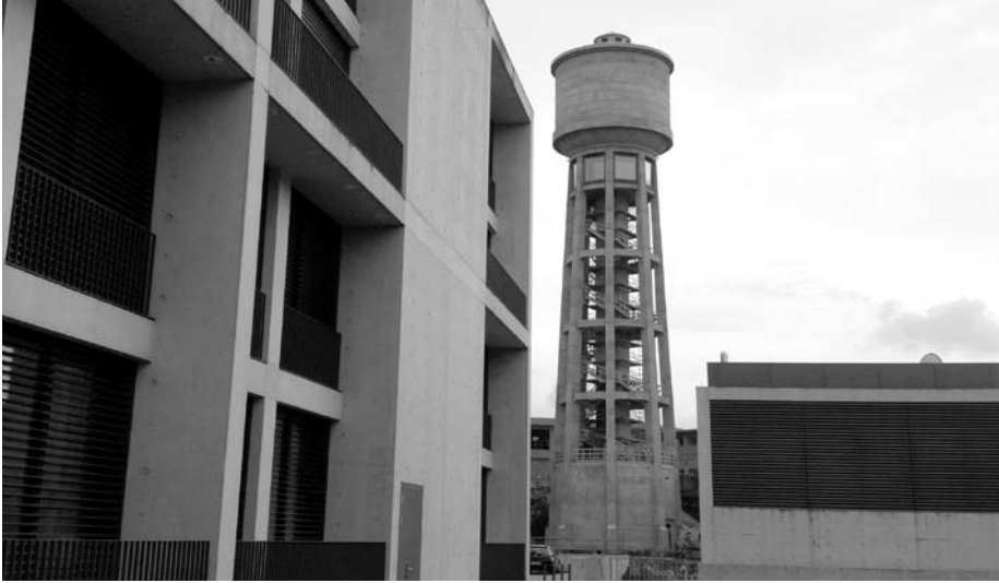
Le château d'eau à Dudelange accueillera l'exposition « The Bitter Years, 1935-1941 » à partir de l'automne 2012

des expositions majeures de l'histoire de la photographie a fini par peser lourd pour les acteurs de la scène culturelle luxembourgeoise.