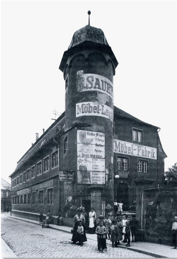
Das Alzeyer Spitalhaus wurde von 1899 bis 1976 als Möbelfabrik genutzt.

Das Hospital verstärkte zweifellos die Zentralität einer Stadt, aber es war nicht unbedingt städtisch. Seine Entstehung ist eher dem Verkehrsnetz als dem Städtenetz zuzuschreiben, auch wenn die Städte nicht ohne Hospitalinfrastruktur auskamen. Insofern sind zwei Grundtypen von Hospitälern zu unterscheiden: die Pilger- oder Elendenherberge, die keine Zentralfunktion für das Umland ausübte und daher nicht an die Stadt gebunden war, auch nicht siedlungsfördernd wirkte, und das Bürgerhospital, das mit zentralen Funktionen im Bereich der Armen- und Krankenpflege bzw. der Altersversorgung typisch städtisch war und auch Nicht-Bürger anzog. Dass es auch Übergänge zwischen beiden Typen und eine Reihe von Mischtypen gab, braucht nicht eigens erläutert zu werden.