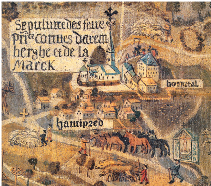
Historische Ansicht des Aremberges mit Hospital

mittleren Maas feststellen, wo die Dichte 1,4 pro 100 km 2 betrug. Im Elsass lag die Dichte mit 89 Hospitälern bei 1,3. Am Mittelrhein standen 86 Hospitäler, was einer Dichte von 1,15 pro 100 km 2 entspricht.