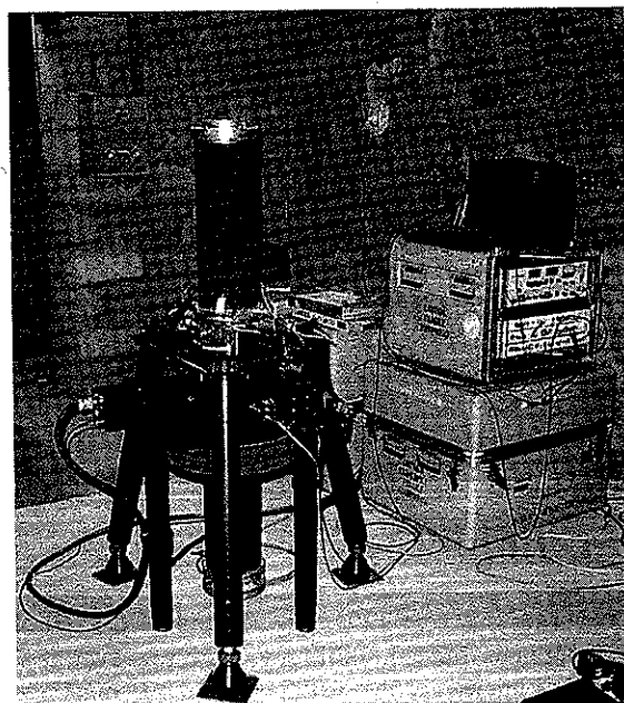
Figure 2. Le gravimètre absolu FG5-111 à la station de Tamanrasset

Pour une description plus détaillée du gravimètre, nous prions le lecteur de consulter le mode d'emploi du gravimètre dont une copie est disponible à l'INCT.