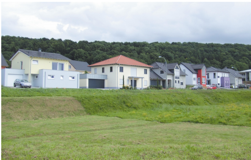
Abb. 3: Neubaugebiet in Perl

Besonders betroffen von der Zuwanderung durch Luxemburger ist die Grenzgemeinde Perl im Landkreis Merzig-Wadern. Hier entstanden in den letzten Jahren viele Neubaugebiete für die zugezogenen Luxemburger (vgl. Abb. 3). Perl grenzt an das französische Département Moselle (Apach im Süden) und Luxemburg (Schengen im Westen). Die Gemeinde Perl weist mit 100 Einwohnern pro km 2 die niedrigste Bevölkerungsdichte im gesamten Saarland auf (Statistisches Amt Saarland 2010).