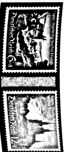
Duitse postzegel van 1940 die de 'teruggave' van Eupen en Malmédy aan Duitsland herdenkt