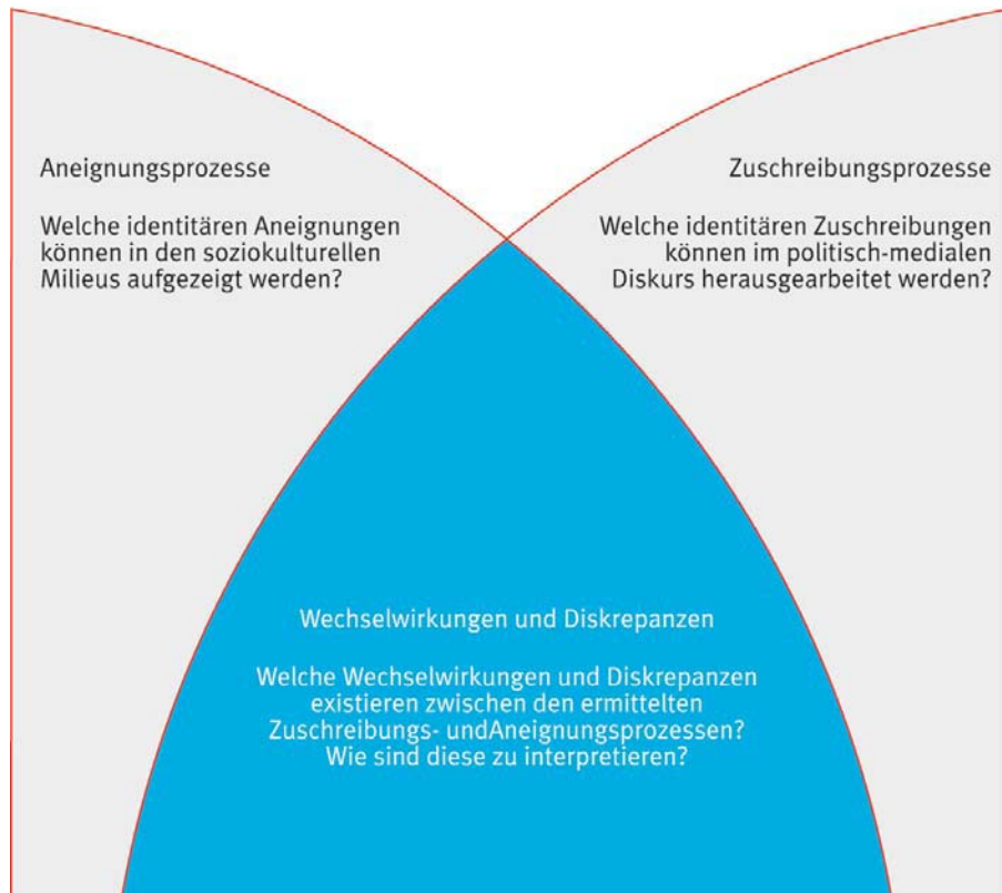
Abbildung 1: Heuristik von Prozessen der Identitätskonstruktion

und angeeigneten Identitäten nach den jeweils betrachteten thematischen Feldern vermag schließlich die Wechselwirkungen und ggf. die Divergenzen zwischen beiden analytischen Kategorien aufzuzeigen, welche als Annäherung an die gesellschaftliche Praxis im Sinne eines ›structure-agency link‹ (vgl. Giddens 1997) auf dem Gebiet der Identitätskonstruktion zu verstehen ist.