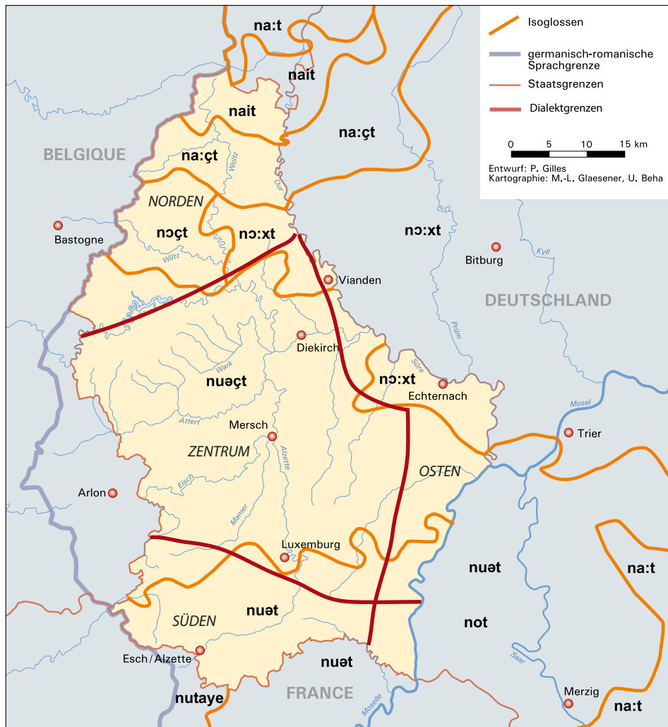
Abbildung 2 Historische, interne Dialektgliederung Luxemburgs (nach Gilles 1999), illustrative Überlagerung mit den Isoglossen des Beispielworts Nacht (basierend auf LSA 25 und DSA 361; nach Gilles 2009).

und Einwohnerzahl das größte Dialektgebiet. Von Bruch wird darüber hinaus noch ein kleineres Dialektgebiet im Westen um das Städtchen Redange/Attert angenommen, das in der Einteilung in Abb. 2 jedoch weggelassen wurde, da es sich nur durch sehr wenige, lexikalisierte Merkmale konstituiert. Für weitere sprachgeschichtliche und dialektologische Details vgl. Keller (1961), Sturm (1988), Newton (1990, 1993), Schiltz (1997), Gilles im Druck .