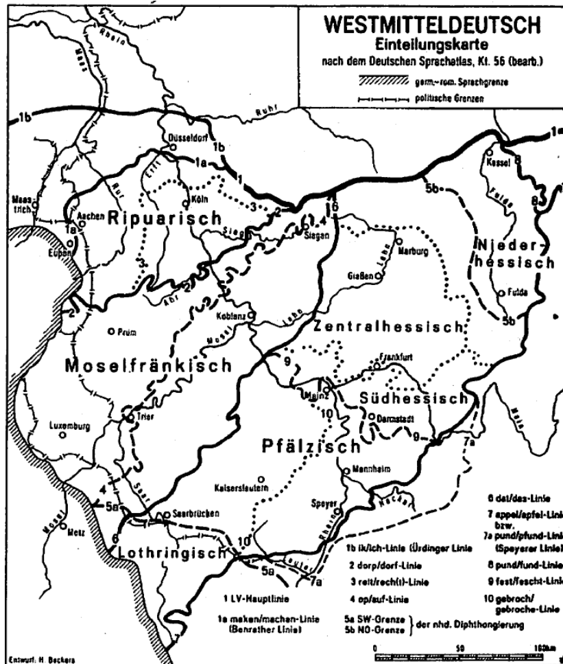
Abbildung 1 Einteilungskarte des Westmitteldeutschen aus Beckers (1980: 469)